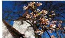
O = Obermichelbach