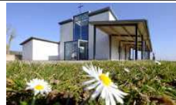
T = Tuchenbach