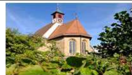
P = Puschendorf