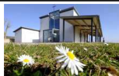
T = Tuchenbach