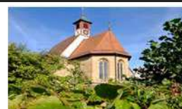
P = Puschendorf