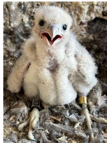
Das ca. zwei Wochen alte Falkenküken mit dem goldfarbenen Vogelwarten-Ring am linken und dem Kennring am rechten Bein.

sie den Kirchturm, seit die Wanderfalken dort brüten. Zum Schutz der jungen Wanderfalken empfehlen die Experten, am Turm ein Sitzgitter anzubringen. Gerade bei den ersten Flugübungen könnte so verhindert werden, dass die Jungvögel abstürzen. Auch aus Veitsbronn gibt es erfreuliche Nachrichten: Dort brüten ebenfalls wieder Turmfalken im Kirchturm. Damit bleiben unsere Kirchen wichtige Rückzugsorte für heimische Greifvögel und zeigen, wie wertvoll diese besonderen Lebensräume mitten in unseren Gemeinden sind.