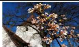
O = Obermichelbach